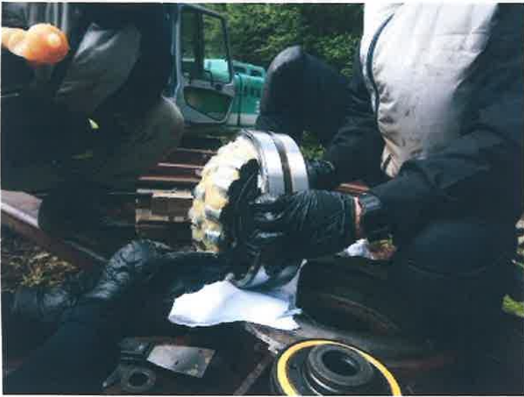
工種 ベアリング給油