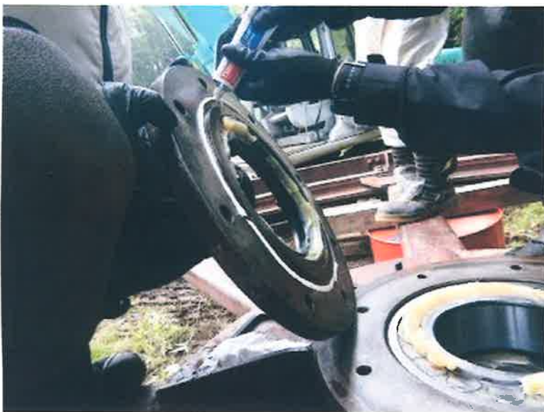
工種 ベアリングカバー取 付け 液体ガスケット塗布