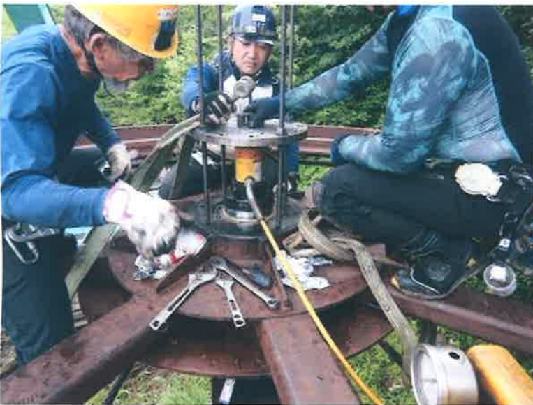
工種 終端滑車取外し 所見 焼き付きあり