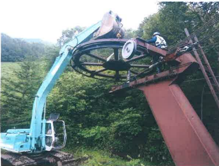
工種 終端滑車取外し