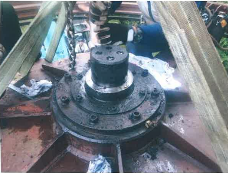
工種 点検台取外し