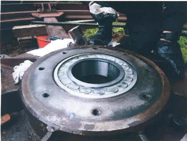
工種 ベアリング取付